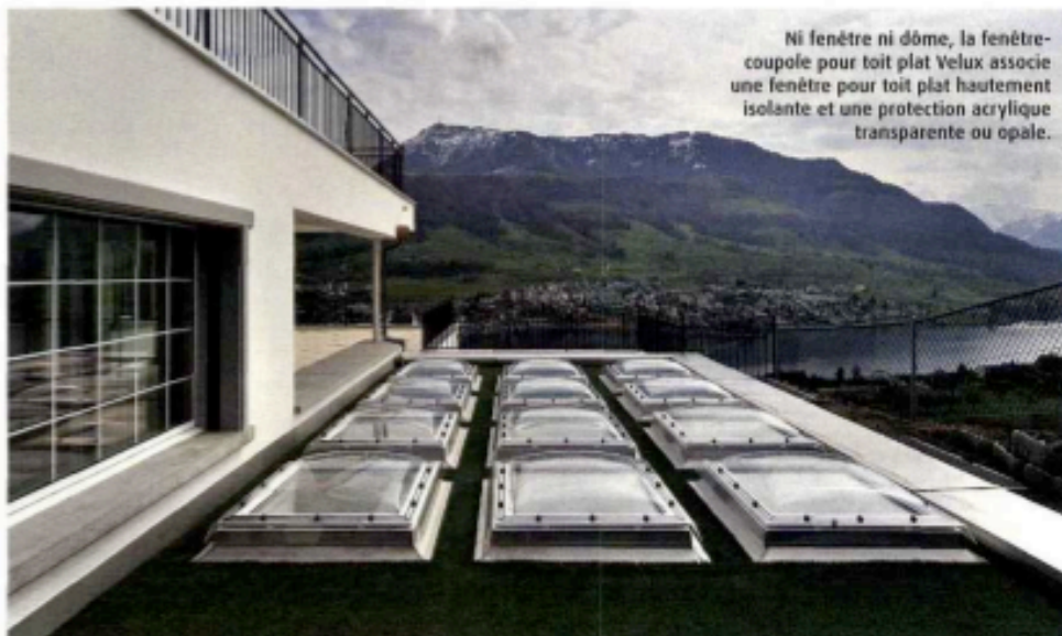
Ni fenêtre ni dôme, la fenêtre-coupoles pour toit plat Velux associe une fenêtre pour toit plat hautement isolante et une protection acrylique transparente ou opale.